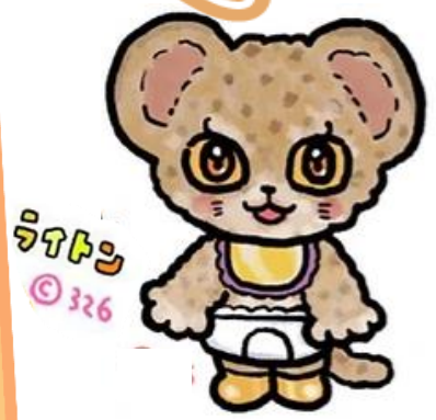
Gold September 公式キャラクター

各地のシンボルや名所を ライトアップしたり、金色のものを 身につけて、小児がんの子どもを応援する、 ゴールドセプテMBERキャンペーン！ 今年は静岡市役所静岡庁舎あおい塔の ゴールドライトアップ、こども病院での ゴールドリボンキャンペーンを行い、 小児がんの子どもたちを応援します！