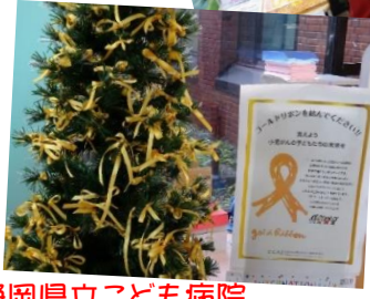
静岡県立こども病院 ゴールドリボンキャンペーン& 病院名掲示ライトアップ